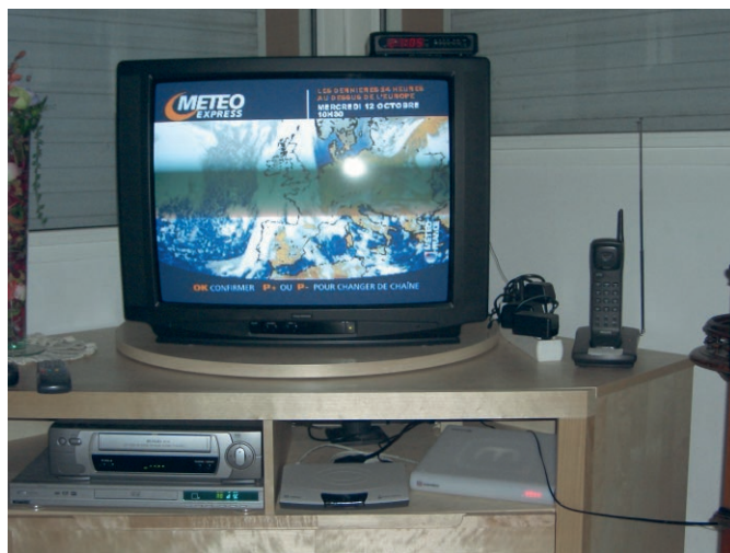
Figure 1 : Cette banale configuration « pèse » 110 W en marche et 41 W en veille. En mode Internet, les 65 W du téléviseur entraînent un appel quasi-équivalent de puissance supplémentaire (niveau local et niveau des infrastructures).

Bien entendu, ce « défi numérique » a fait l'objet de bien des débats en ce début du XXI e siècle lors des deux Sommets Mondiaux, organisés à l'initiative de l'ONU sur le continent africain, ce qui n'est d'ailleurs pas une coïncidence. Ainsi après Johannesburg (2002), celui de la Société de l'Information (SMSI/WSIS) analysant l'omniprésence de l'Internet lui assigne un objectif planétaire : raccorder à l'Internet la moitié de la population en 2015. Gigantesque est ce double défi de l'Internet « durable » et complexe l'analyse !